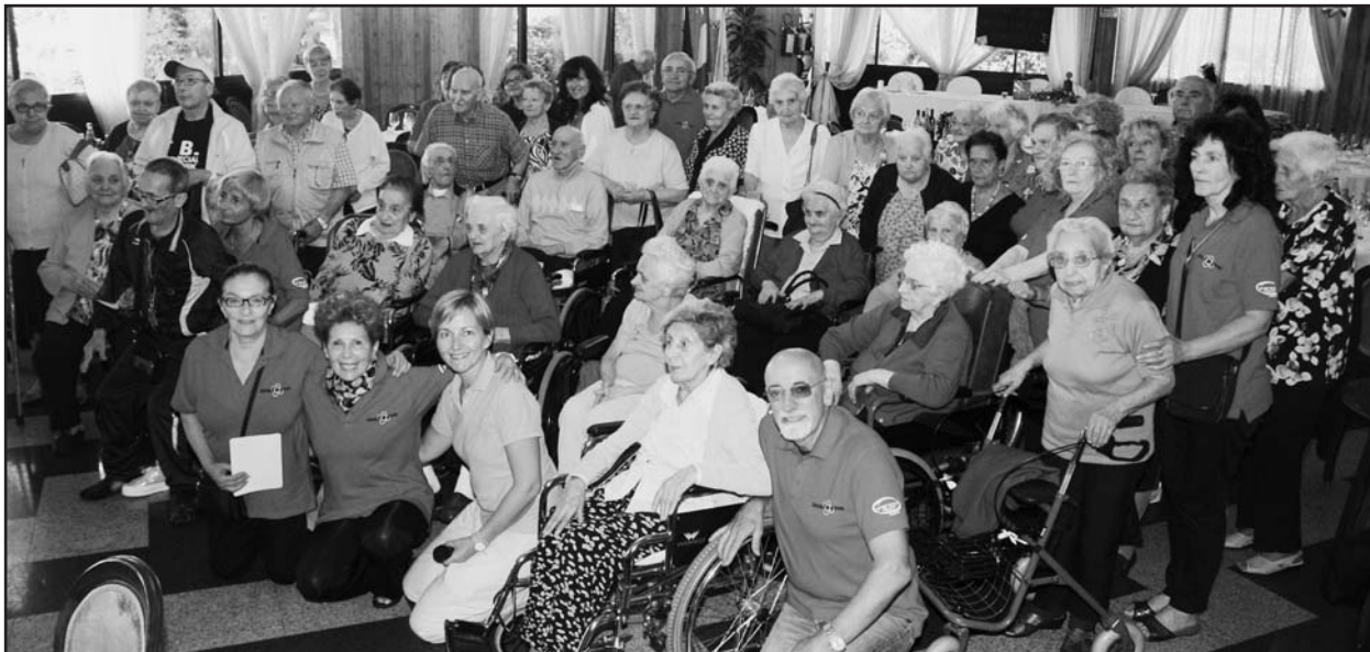
I partecipanti alla piacevole giornata trascorsa al Green Park Boschetti.

Operatori e volontariato a servizio degli anziani