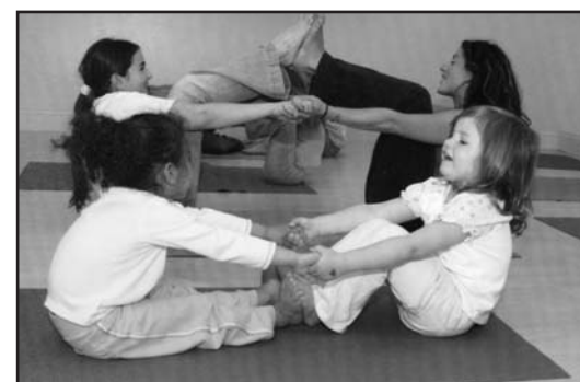
Il coinvolgimento dei bambini.

Vi aspettiamo! mamme e bambini. Info LA SFERA A.S.D.&C. via Pellico 20 Carpenedolo corsi yoga@libero.it www.corsiyoga.com, cell. 338/3850339