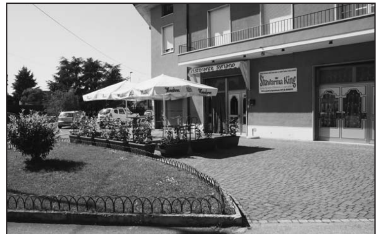
Ampi spazi all'aperto per una ristorazione estiva. TRIPADVISOR... PER TE.

PIATTI PER VEGETARIANI E VEGANI DOLCI TIPICI SIRIANI E VEGANI