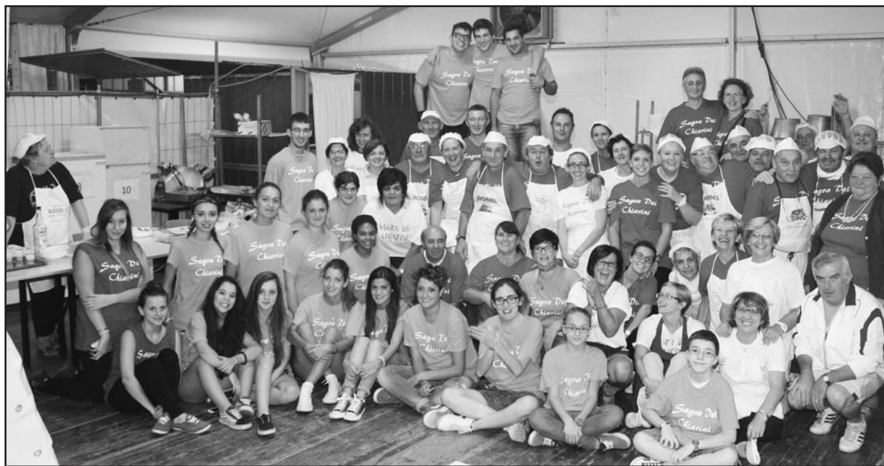
Grande entusiasmo degli organizzatori per la riuscita della sagra.