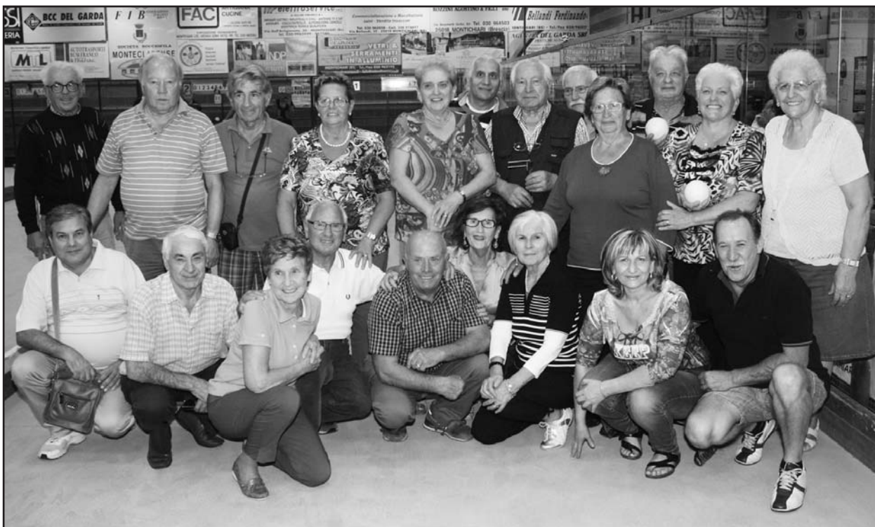
I vincitori con le bocce in mano e i partecipanti alla simpatica gara.